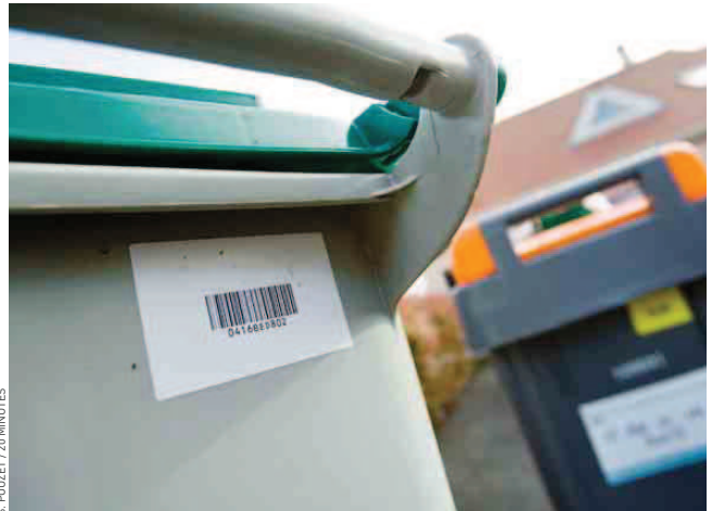
Les poubelles de la communauté de communes sont équipées de codes-barres.

Une cinquantaine de collectivités en France pratique déjà ce type de ram-